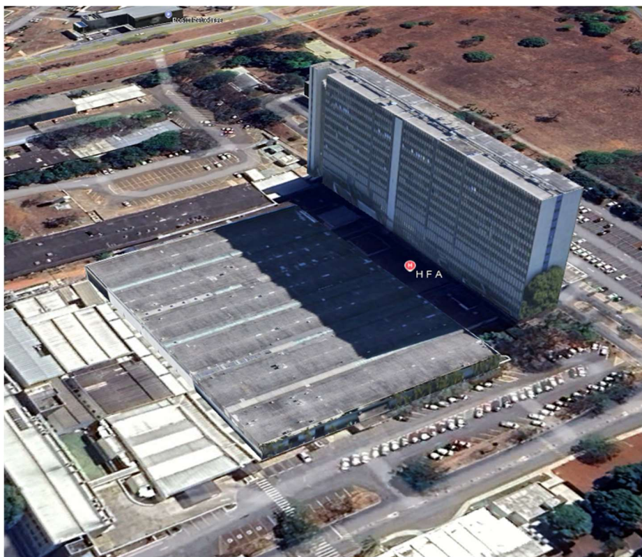
Figura 1 – HFA

Parcela de 2,00 m², por tipo de equipamento, do imóvel, a qual corresponde a uma área destinada à atividade de máquina de vendas automática para atender ao público interno do HFA. Coordenadas Geográficas: -15.8009184843696, -47.934757496442764 .